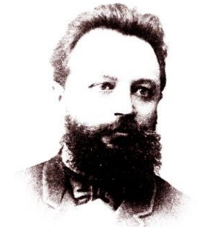
Mihail Tchigorine (1850-1908)

Leçon 7 : le GDA après 3. é4 → ...Cç6 « à la Tchigorine »