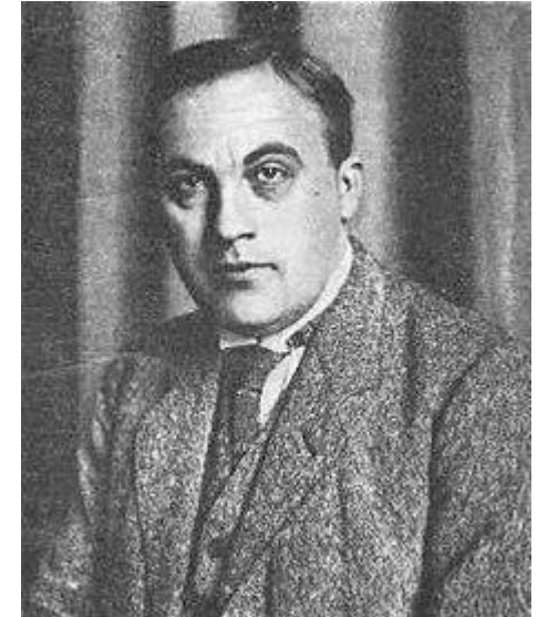
Efim Bogoljubov (1899-1952)

« Lorsque j'ai les blancs, je gagne parce que j'ai les blancs. Lorsque j'ai les noirs, je gagne parce que je suis Bogoljubov. »